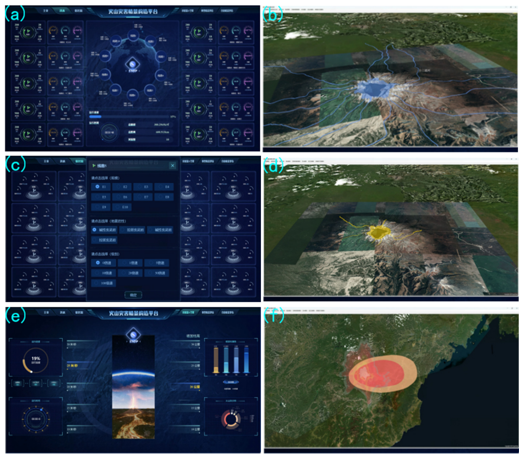
(a)火山洪水模拟控制界面;(b)火山洪水模拟演示;(c)火山熔岩流模拟控制界面 (d)火山熔岩流模拟演示;(e)火山碎屑流+空降模拟控制界面;(f)火山碎屑流+空降模拟演示

(5)设置多倍速模拟可视化,基于情景的火山综合灾害持续时间可能需要1~10 h,需要设计10~100倍数的快速模拟仿真。